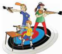
Carabine et Pistolet Ecole de Tir